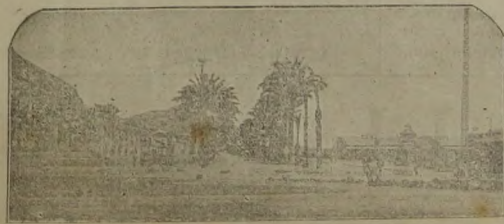
Alicant — Paseo de Gómis