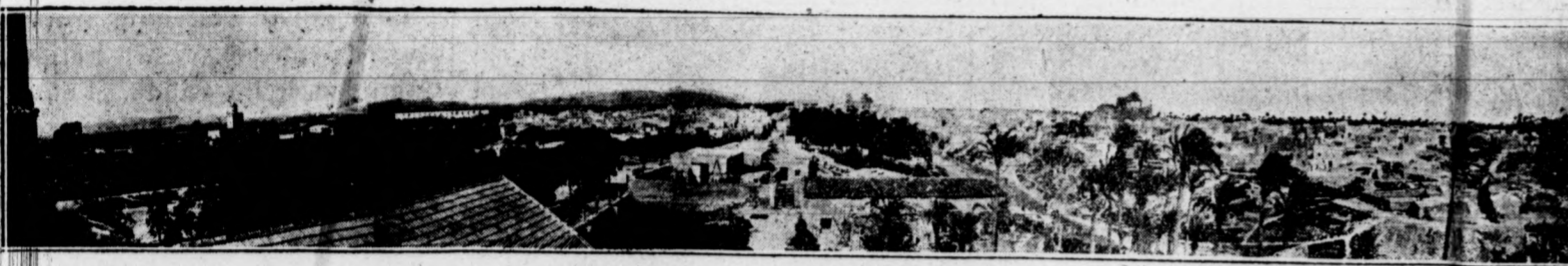
ELCHE. - Vista panorámica