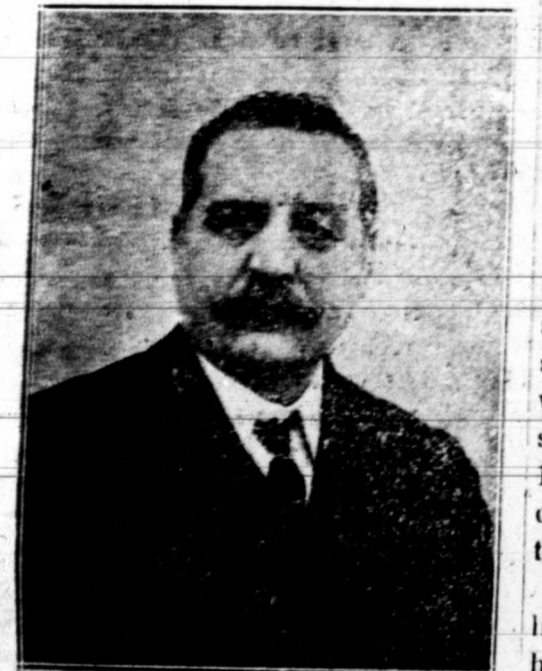
Don Tomás Alonso, Alcalde presidente del Ayuntamiento de Elche