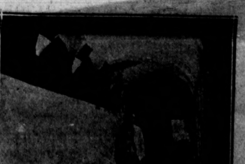
ELCHE. - El célebre doctor Campello, en su visita al Convento. (Curiosa fotografía, obtenida, quebrantando la clausura, por especial permiso.)

Sin hacer un examen detenido de lo mucho y bueno que contiene el citado manuscrito, estudio que ocuparía un desmedido espacio en estas columnas, sólo traslado la parte que hace referencia á