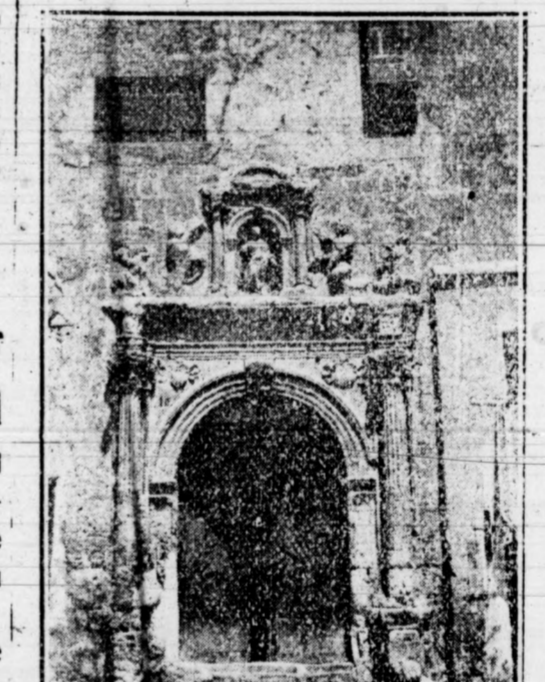
ELCHE. Puerta de la Merced, estilo Renacimiento

No es, pues, de admirar el hecho que hemos comprobado en estos días, cuando pasábamos por las calles de Elche acompañados por el Sr. Gómez: los ilicitanos le saludaban á su paso: muchos con muestras evidentes de cariño, de afecto, de gratitud... todos con respeto.