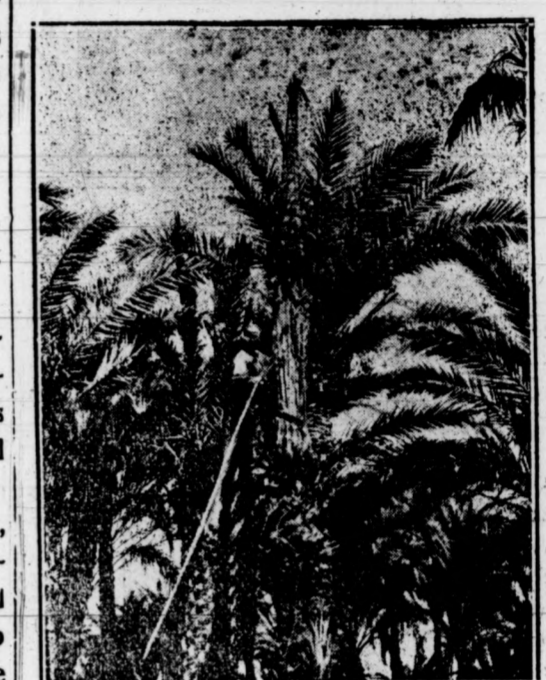
ELCHE. La colta de palmas.