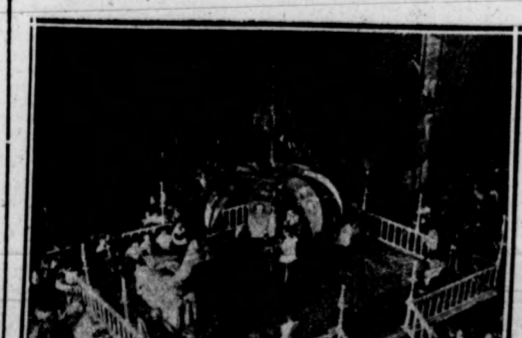
ELCHE. La «Granada», después del descenso.

En un garz-huerto-compuesto de varias parcelas de tierras, donde hoy está parte de Elche habitaba un moro tan rico como influyente, pues era un poderoso Cadí. Tuvo sólo una hija de la que se enamoró, apuesto y gallardo que renegar de su fe y casarse con un cristiano; pero para poderse casar tuvo que renegar de su fe y abrazar la fe árabe se les llama tal hacen, en es decir, á los cristianos renegados—mahometanos. Desde que se hacen le llamaron Elich el renegado todos