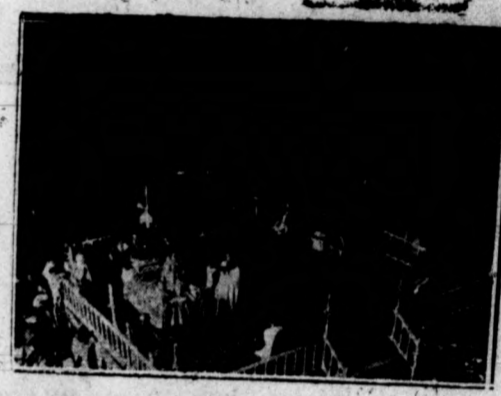
ELCHE. - Un episodio de «La festa».

rostro de difunta sobreposat, ab la palma al muscle, sobre unes andes; ab un oñbertor de domas carmessi, borlas de or y argent, al rededor ab vel de sseada y or que la cobre ai redor una guarnitío de or y argent y a les esquines de los dits co-