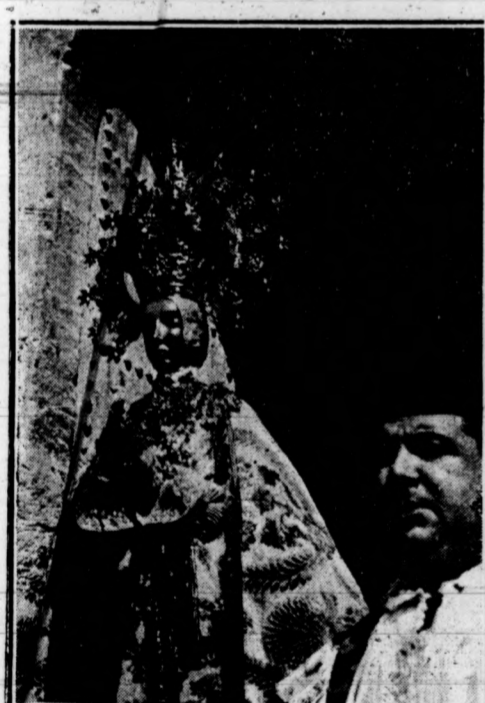
ELCHE. - Último retrato de la Virgen de la Asunción.

Agosto de 1918.—Pedro Ibarra. Archivero, Bibliotecario y Arqueólogo; Cronista de la ciudad; Correspondiente de la R. Academia de la Historia; de la Arqueológica barcelonesa; Hispánica de Burdeos; Cultura Valenciana; Instituto Arqueológico de Berlin, etc., etc.