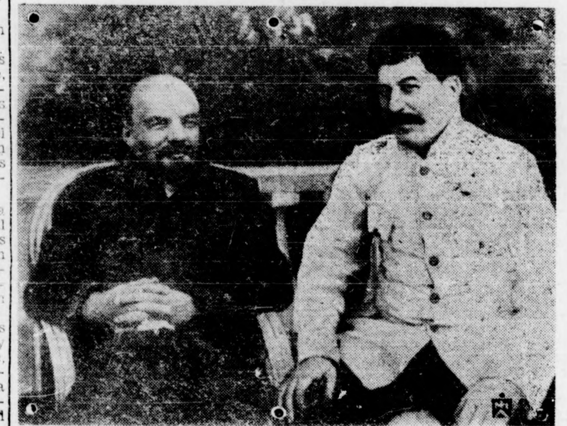
LENIN Y STALIN EN LOS PRIMEROS MOMENTOS DE LA REVOLUCION RUSA

retaguardia, para facilitar la labor y el triunfo de la República. Necesidad de abrir las puertas para que vayan saliendo todos aquellos compañeros que de un momento a otro han de incorporarse porque una vez más a la lucha, vemos la exige la guerra.