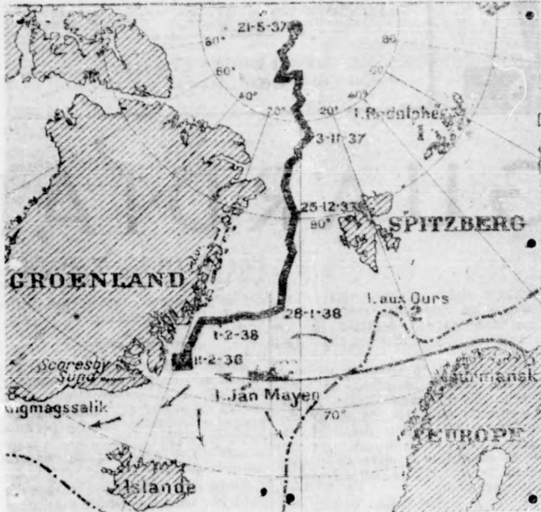
RECORRIDO DEL BANCO A LA DERIVA

Los éxitos científicos alcanzados tanto y progreso en todos los órdenes, en la ciencia, en las letras, en