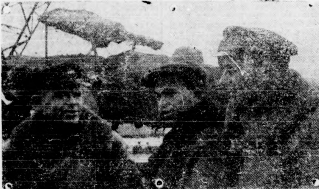
EL AVIADOR VLASOV Y SUS CAMARADAS QUE SALVARON LA EXPEDICION

pués de conquistar el Polo, suponen las artes, en la industria, en la otras tantas conquistas para la hu- vida y en la felicidad de los hom-