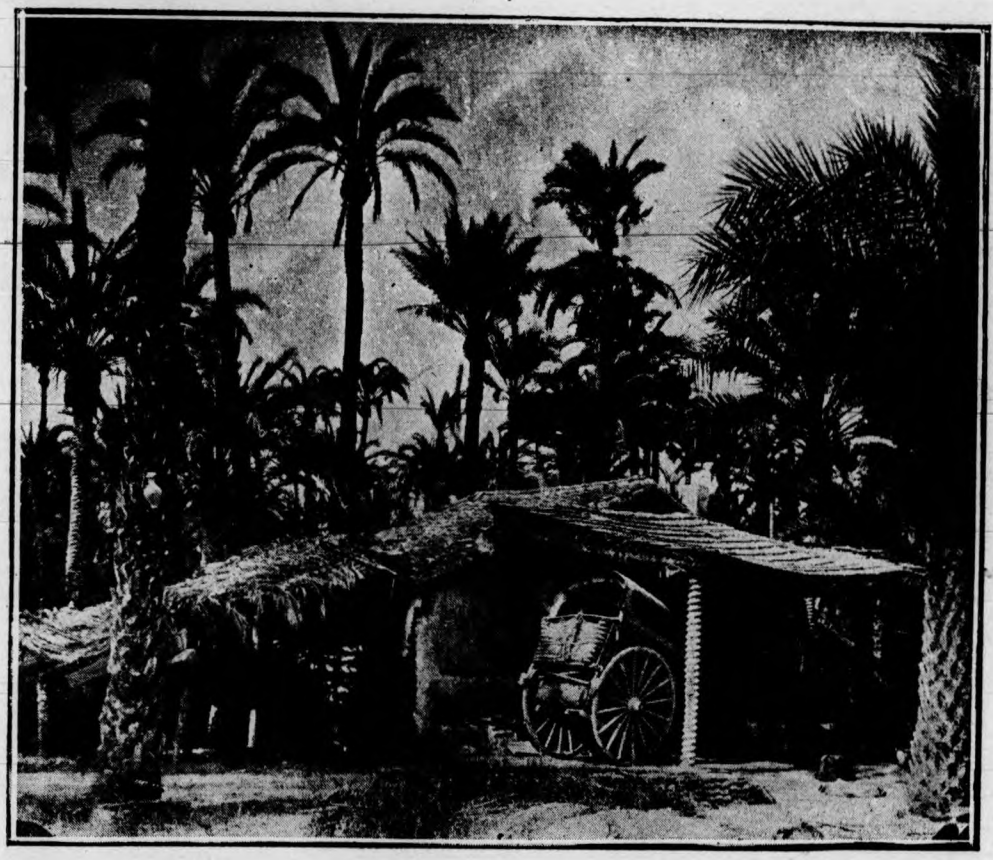
HUERTO DEL ROSARIO