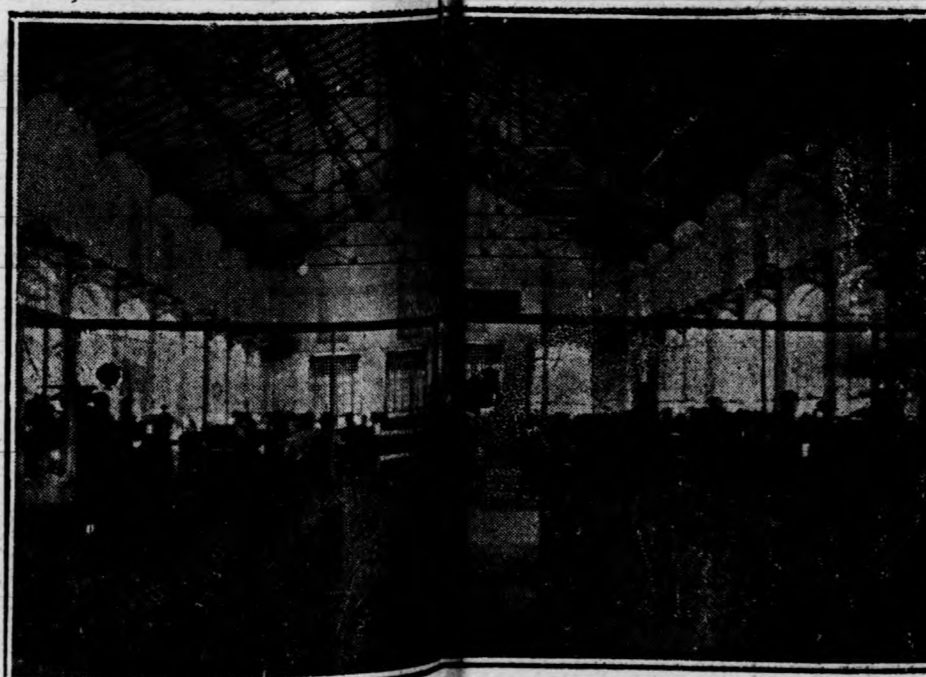
SECCIÓN DE CONFECCIÓN