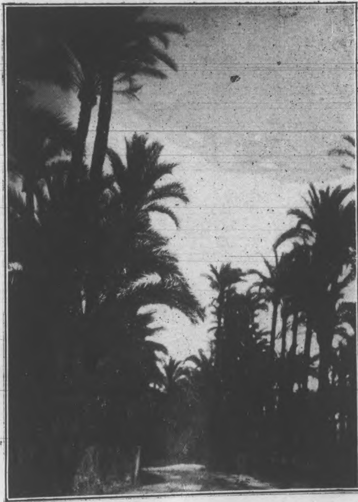
Un camino entre huertos