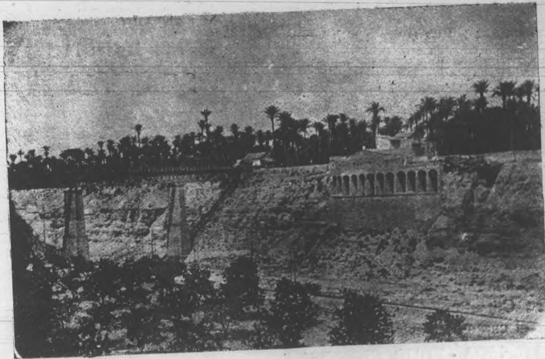
Puente de hierro y Molino Real