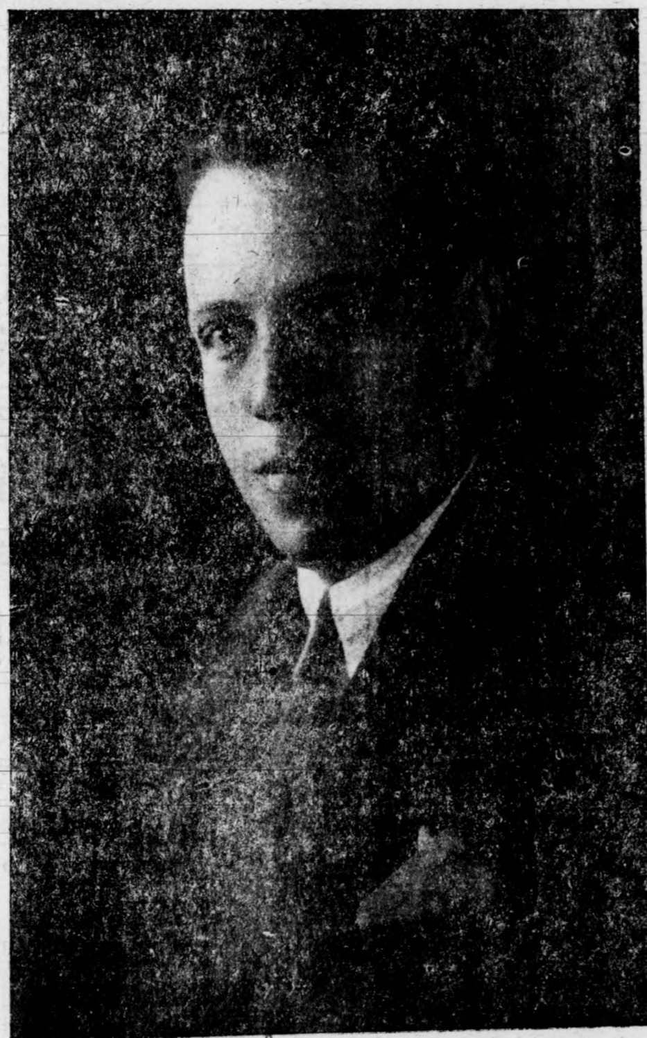
ANGEL VERGEL, laureado poeta

Y si como poeta triunfa «allí do va» como prosista maneja el lenguaje con todo primor, y sus cuentos y crónicas, sus artículos periodísticos, flor de un día en la hoja volandera, son conservados con