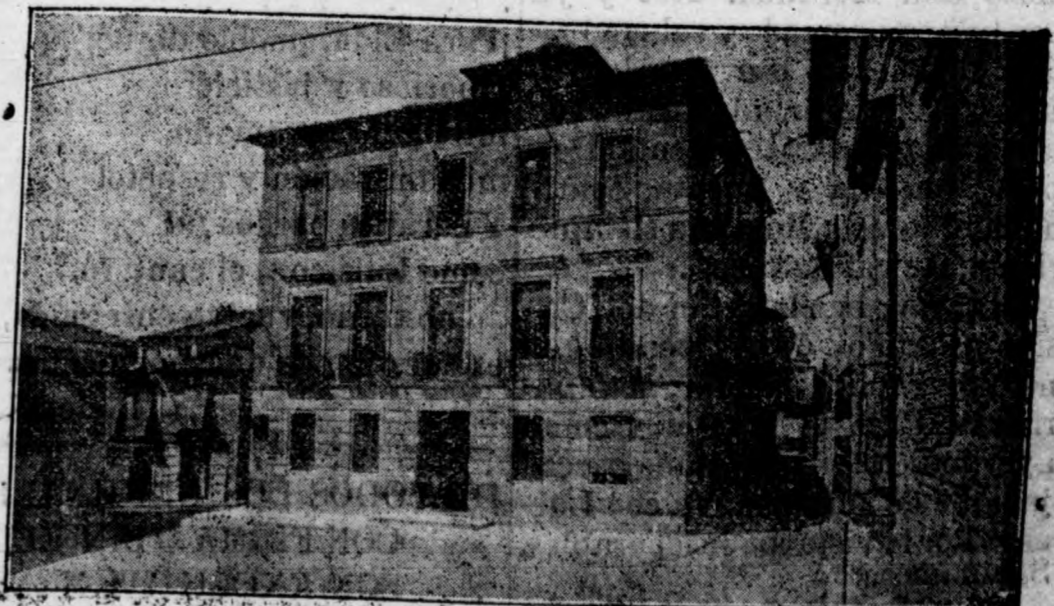
Edificio del Ayuntamiento