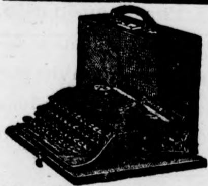
Muebles para Oficinas