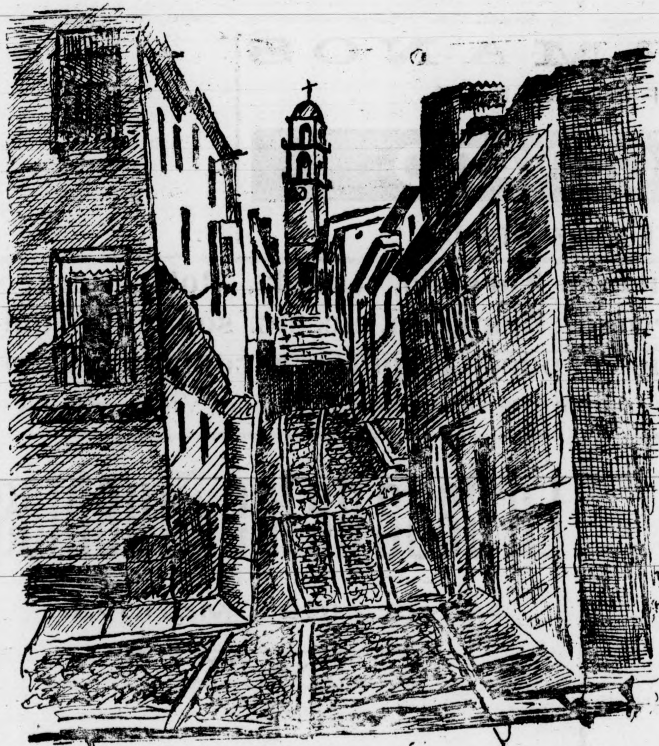
Dibujo, J. CORBI