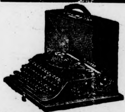
Muebles para Oficinas