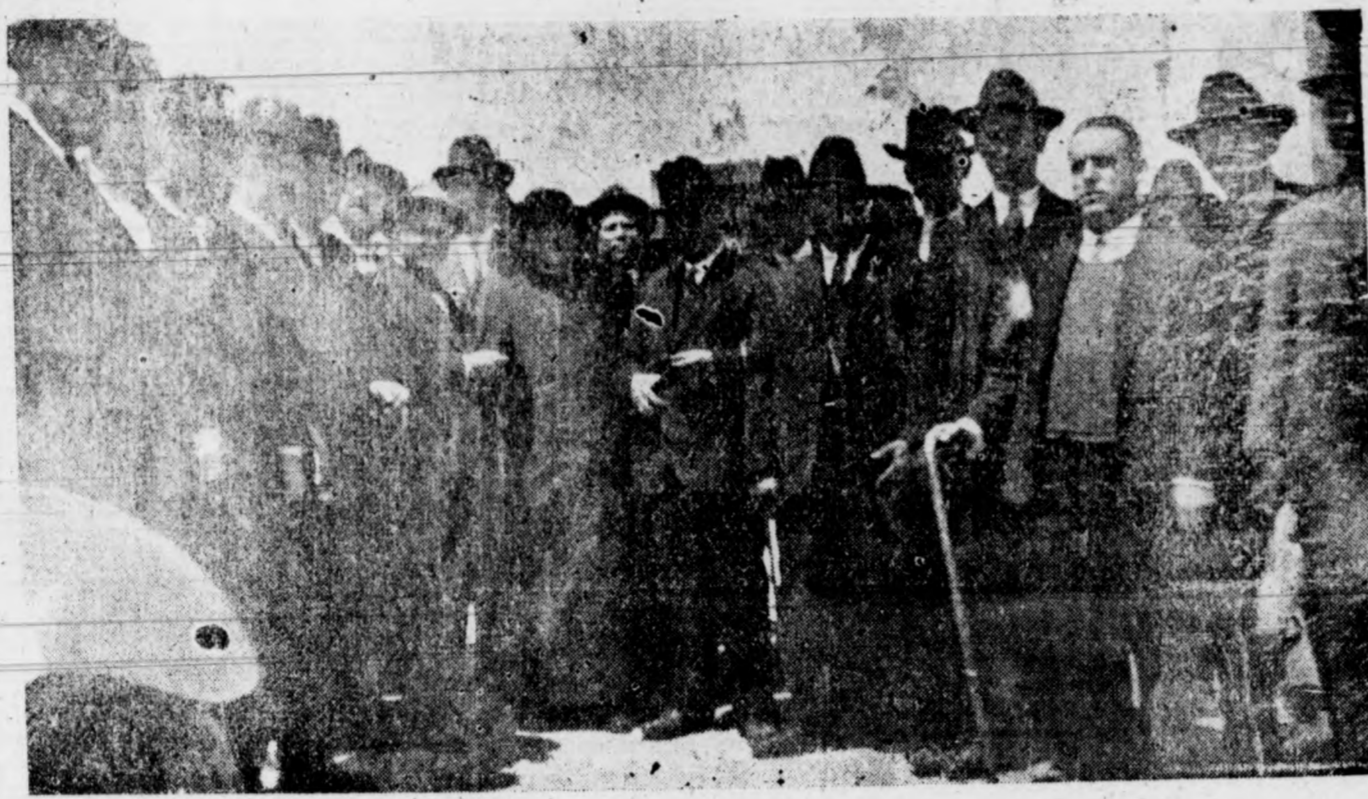
Autoridades, Prensa y otros invitados en la fiesta de Torrellano

Por acuerdo de la Permanente se saca a concurso la adquisición de 37 uniformes de verano completos para la Guardia Municipal, Voz pública y Maceros, pudiendo presentarse pliegos acompañando muestra del género, hasta el día 15 del actual a las doce horas en el Salón Alcaldía; y los uniformes tendrán que entregarse confeccionados el día 15 del próximo Junio.