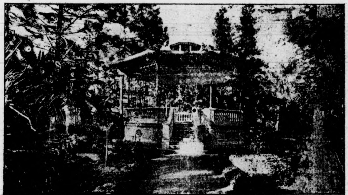
GLORIETA DEL DR. CAMPELLO

Este periódico ha sido visado por la censura.