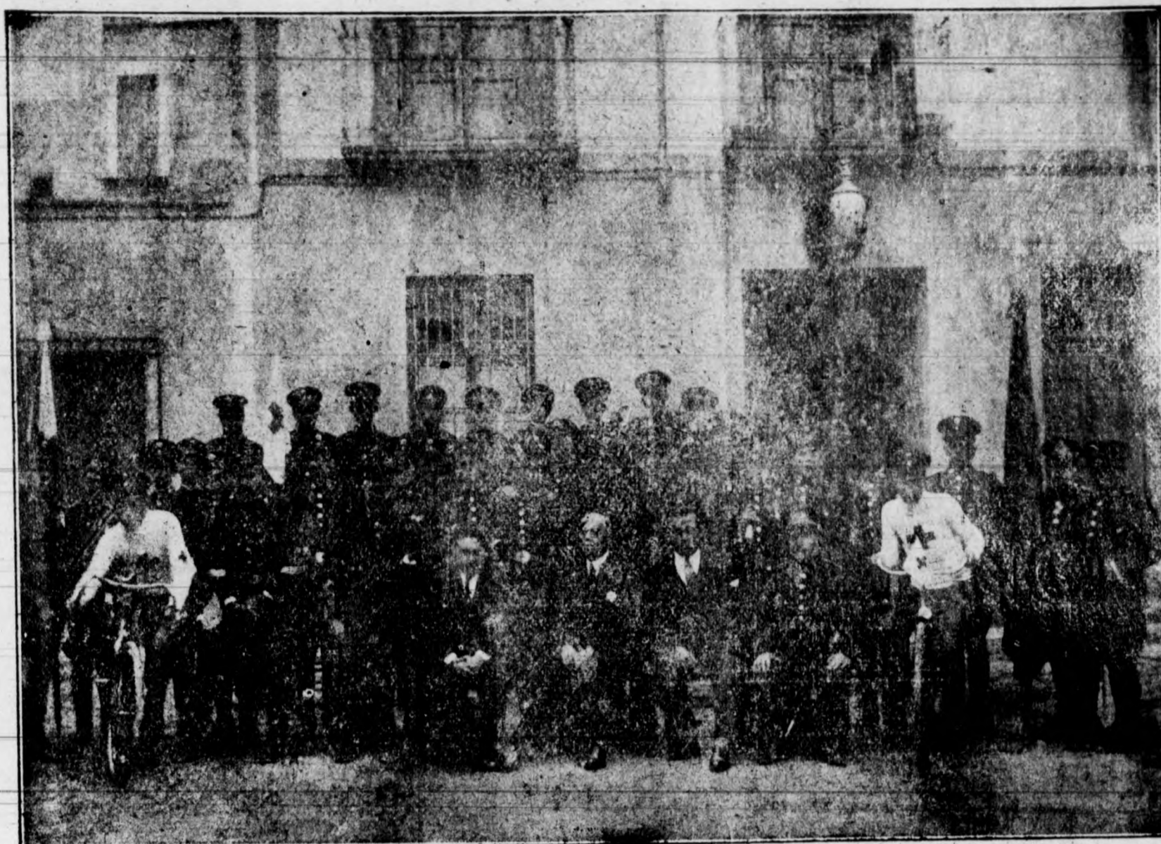
Personal de la Brigada de Camilleros de la Cruz Roja de Elche