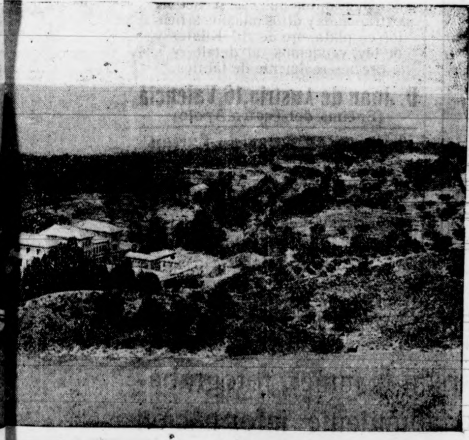
BUSOT - Otro aspecto del balneario