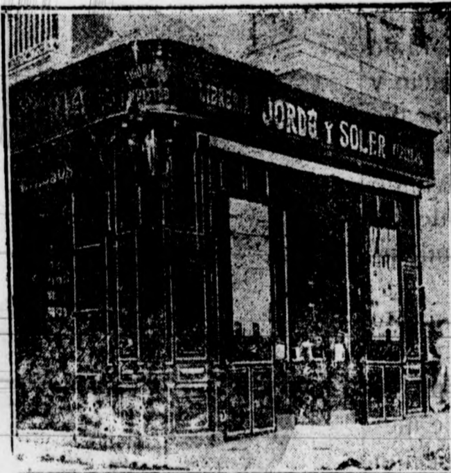
Sagasta, 2 y Plaza de la Constitución, 10 — ALICANTE

Librería Internacional DE Jordá y Soler Papelería y Objetos de escritorio Gran surtido de plumas estilográficas, cintas para máquinas de escribir : : : Figurines, revistas nacionales y extranjeras - Libros rayados : : : : : :