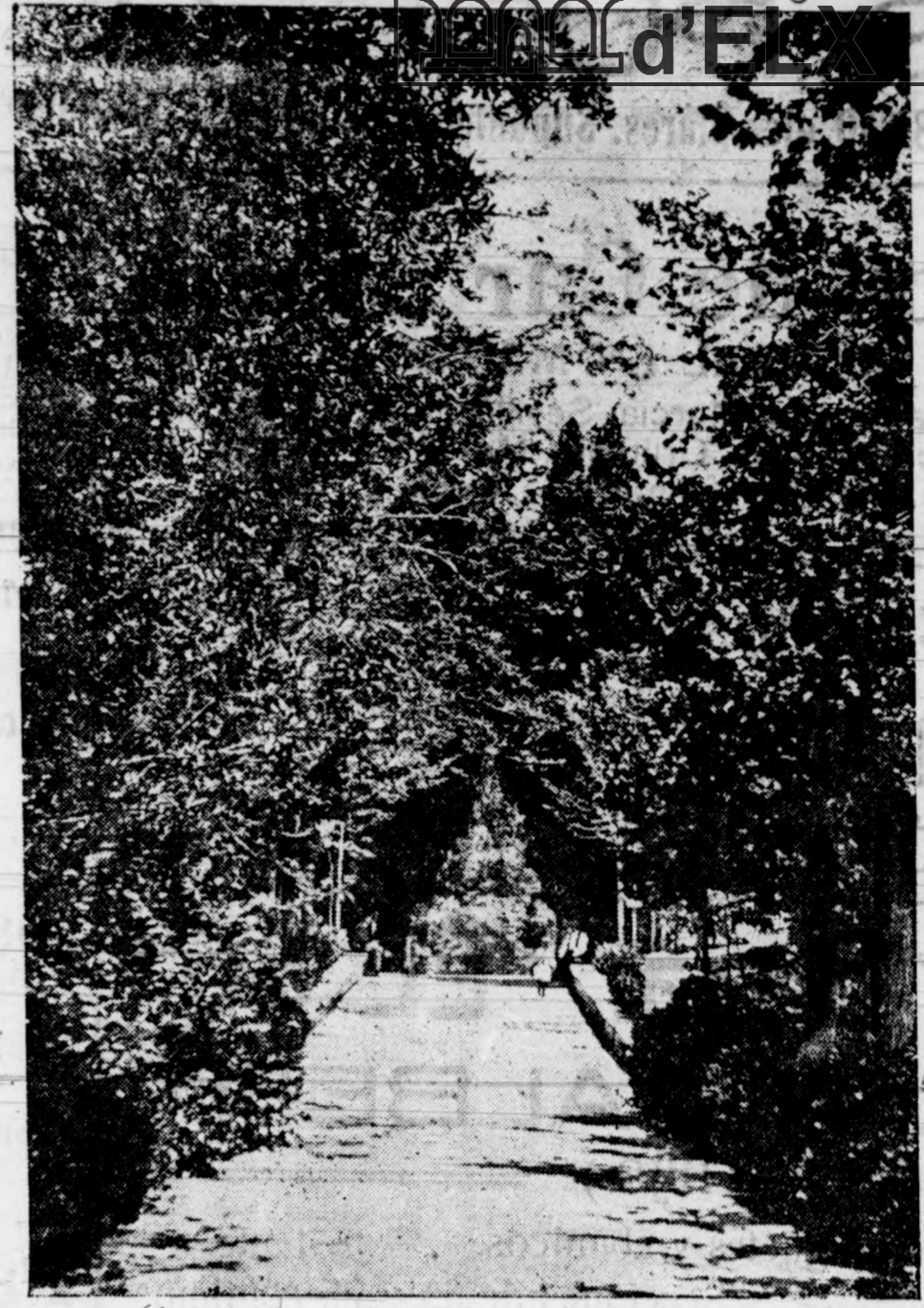
Busot — Paseo entre el bosque