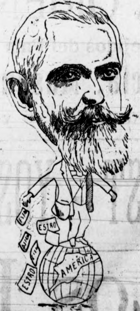
D. Rafael Altamira y Crevea