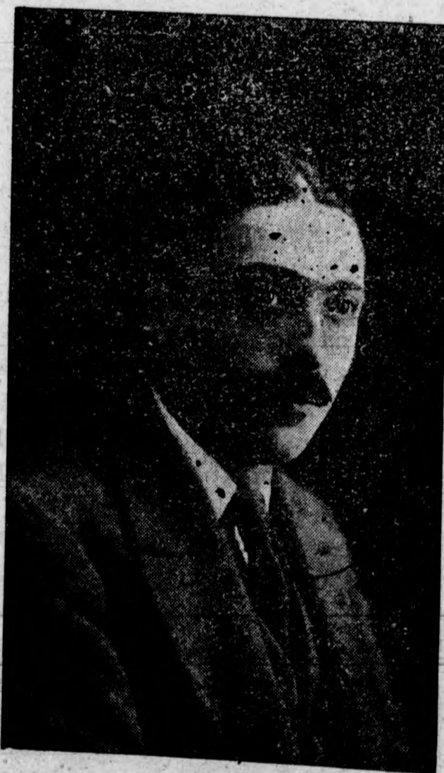
El maestro compositor Modesto Pérez