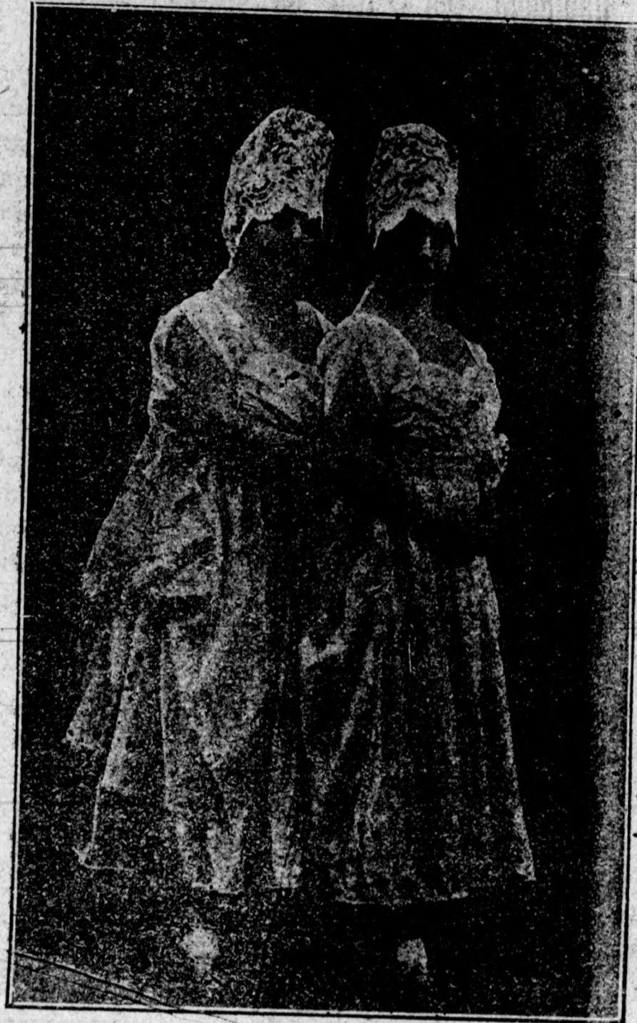
Las aplaudidas bailarinas hermanas Corales