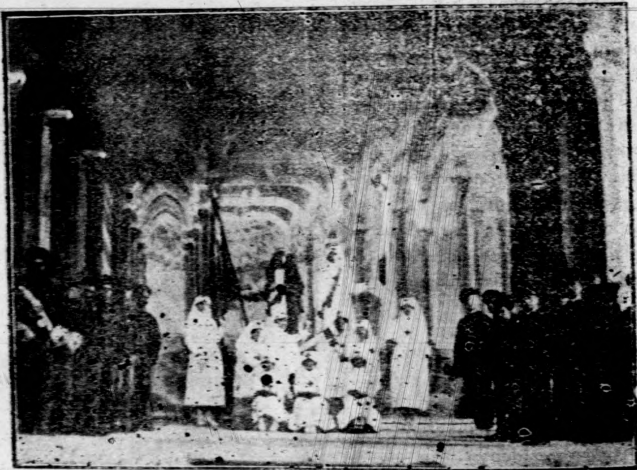
Quelco elógico de la Cruz Roja