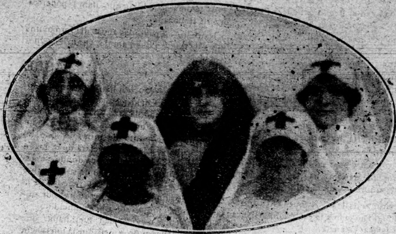
Precioso conjunto de camilleritas

hora y media, en ferrocarril, al pie del Guadarrama al Este de Madrid y coronando un quebrado y extenso penascal poblado de robles, carrascas y lentiscos, como un oasis entre dehesas, bayales y tierras pizarrosas, se halla el grandioso Real Sitio y Monasterio de San Lorenzo de «El Escorial» obra inmortal y eterno recuerdo de aquel gran emperador que se llamó Felipe II que quiso perpetuar la gloriosa batalla de San Quintín y dejar una huella de la grandeza de su espíritu cristiano y fe incansables.