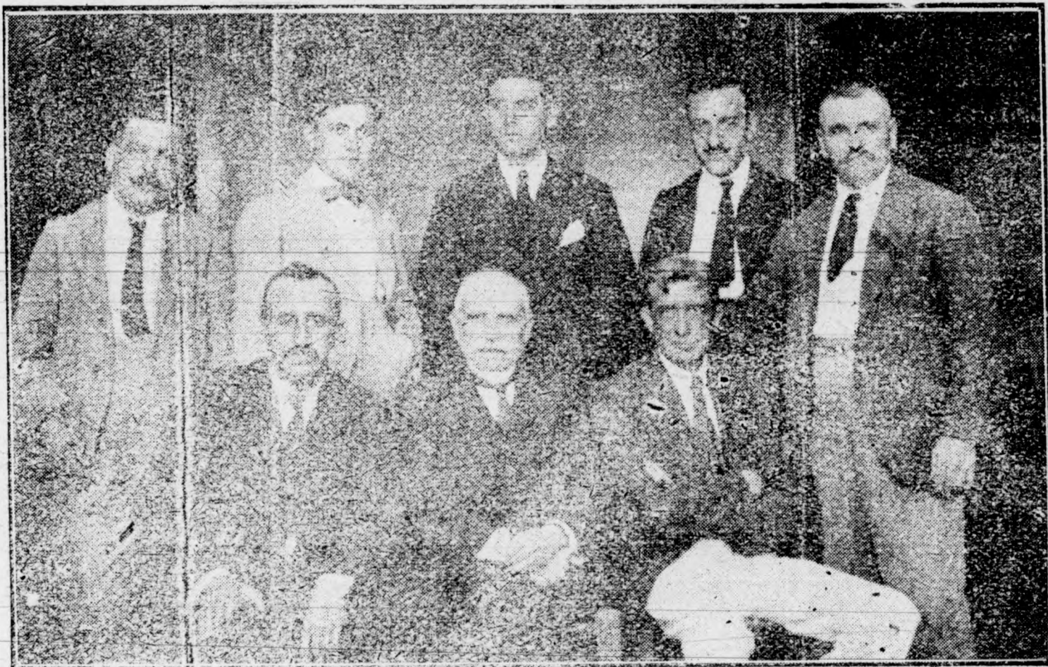
DENIA. Cuerpo médico