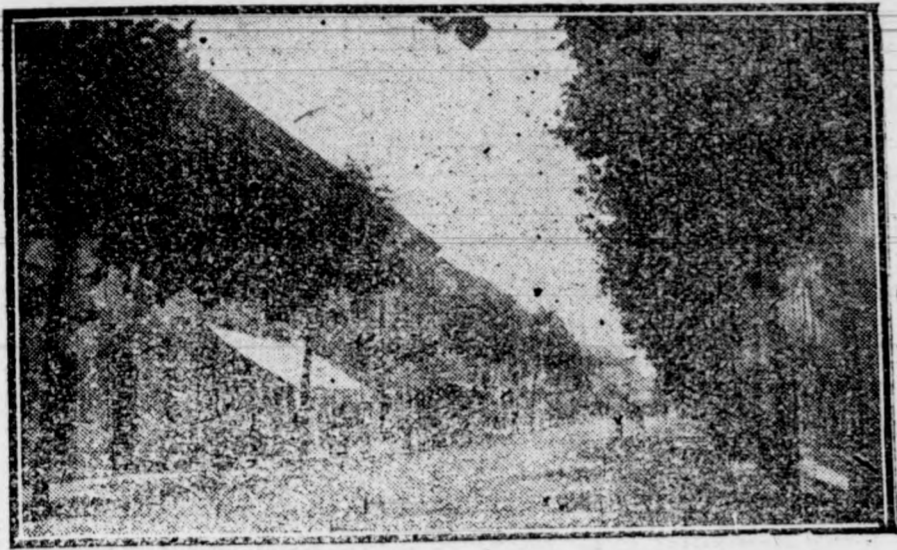
DENIA.—Calle del Marqués de Campos