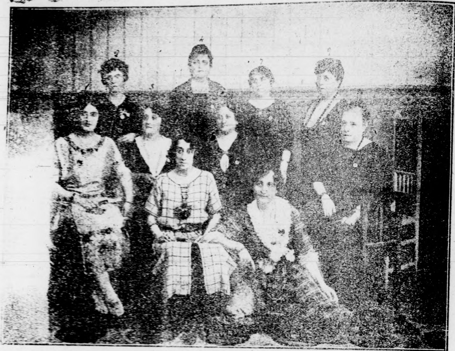
Enfermeras de la Cruz Roja de Alicante, que se han embarcado a S. M. la Reina para marchar a Marruecos.