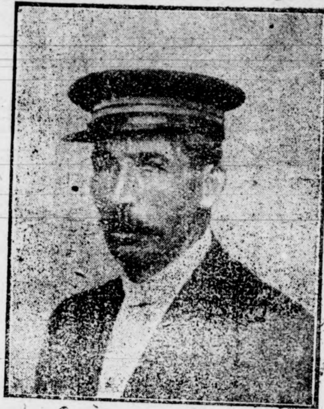
Alguacil del Ayuntamiento de Denia, que está realizando importantísimos trabajos para escribir la historia de aquella población.