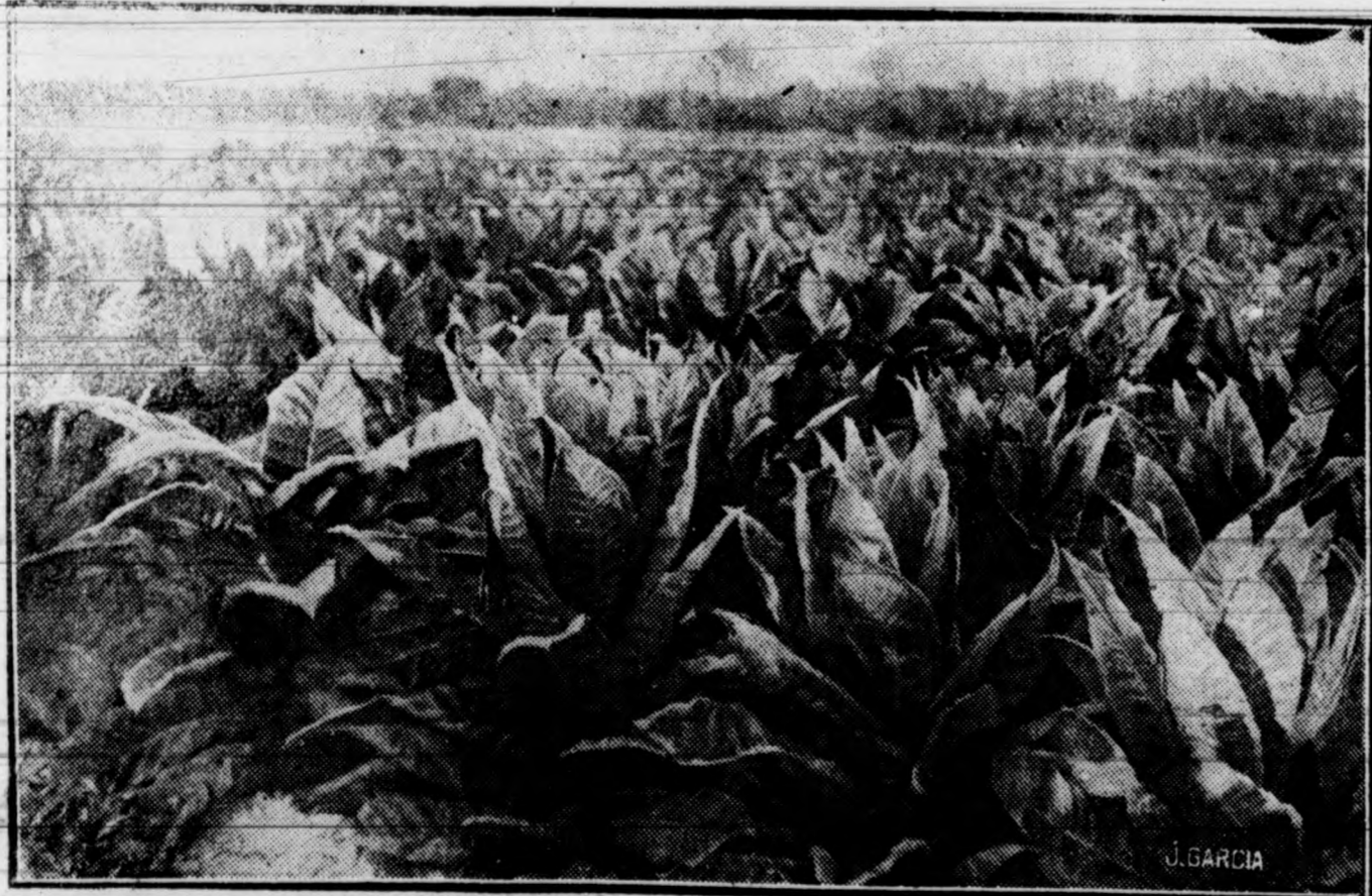
Estación de Estudios de Regadío.—Elche

La semilla del tabaco, por su pequeñez y constitución, es de germinación lenta, difícil y desigual; no debe extrañar por ello, que tarde en nacer, a veces, más de un mes, aunque lo corriente es que a los quince o veinte días hayan