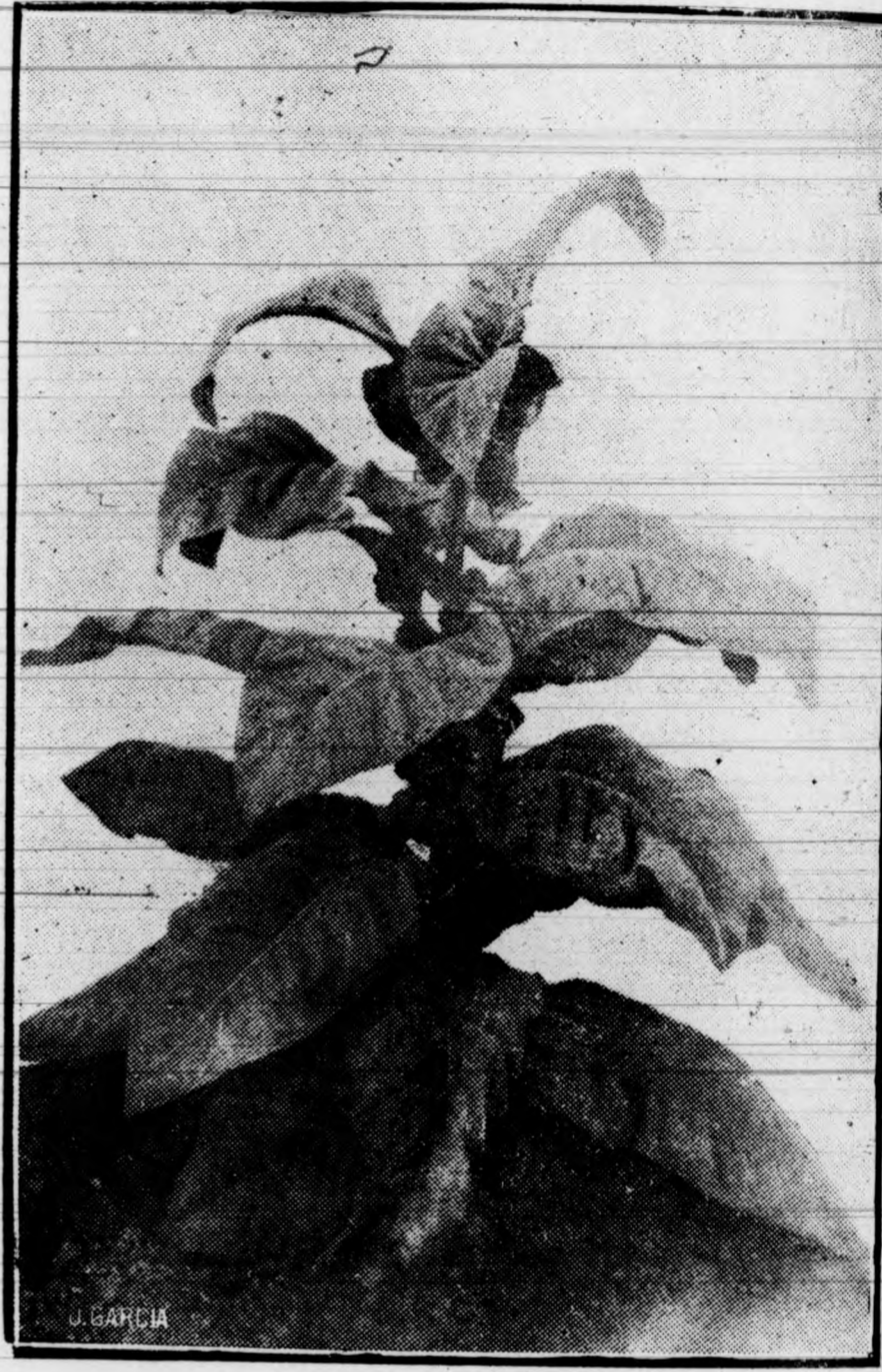
Estación de Estudios de Regadío.—Elche

En nuestros climas debe hacerse el semillero en cama caliente; es decir, operando del modo siguiente: se abre en el suelo una zanja de un metro de ancha y de 35 a 40 centímetros de profundidad (un par de palmos cortos), dándole la longitud que sea necesaria con arreglo al número de plantas que se han de cultivar. En el fondo de ella se pone una capa de estiércol caliente, en plena fermentación, de unos 20 centímetros de espesor (poco menos de un palmo), con objeto de que proporcione calor, pero sin que lleguen a ella las raíces del tabaco, pues se quemarían. Sobre esta capa se coloca otra de análogo espesor de tierra buena, que se desmenuza y mezcla con estiércol frío