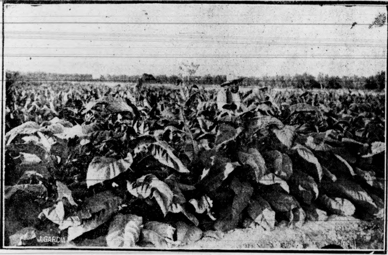
Estación de Estudios de Regadío.—Elche

LA SIEMBRA. —Se hace mezclando la semilla con arena fina, para repartirla mejor y cubriéndola ligeramente con esta clase de arena o