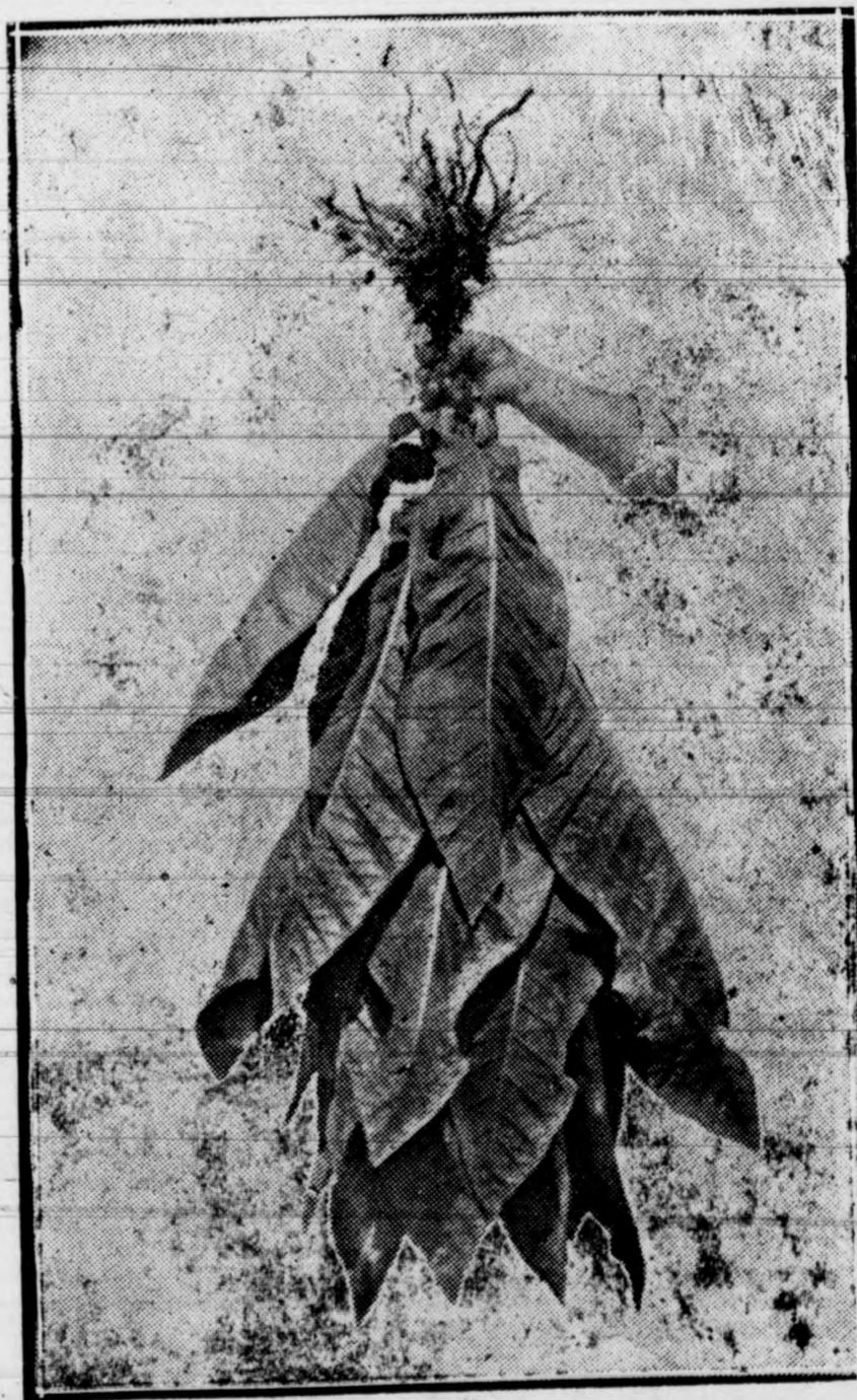
Estación de Estudios de Regadío - Elche.

El sulfato amónico y el nitrato pueden fraccionarse poniendo la mitad antes de la siembra y la otra