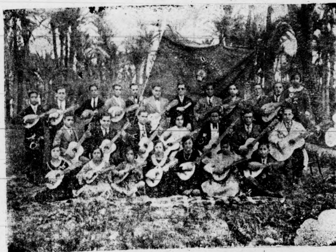
Grupo de la Orquesta «Arte Juvenil» Filial de ORFEÓN ILICITANO

Fué una de las veladas más grandes que Orfeón Ilicitano ha organizado, saliendo muy contentos y satisfechos todos el público y socios que nos honraron con su asistencia.