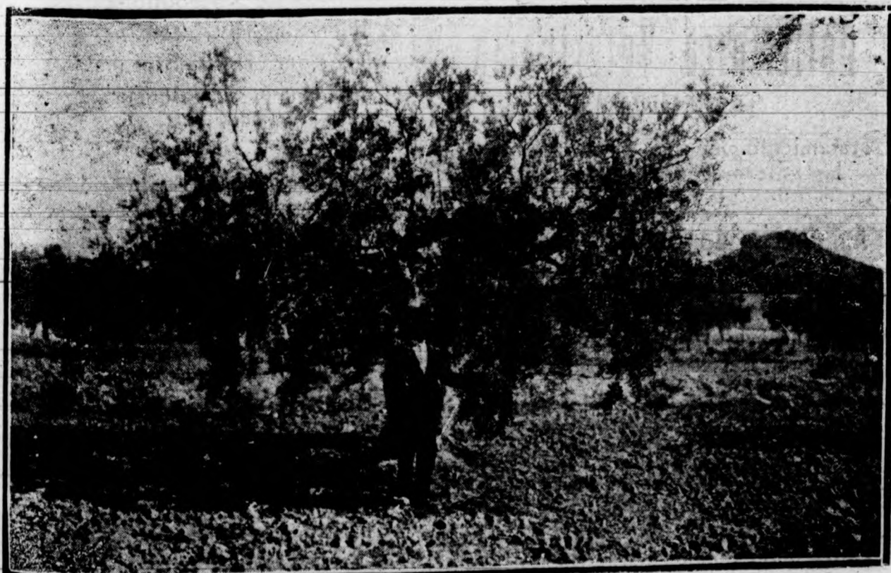
UN OLIVO BIEN PODADO

rales, es la poda la que más influye en la producción del olivo y la realidad nos indica que le prestan poca atención los agricultores. Basta recorrer nuestros campos para ver centenares de olivos de co-