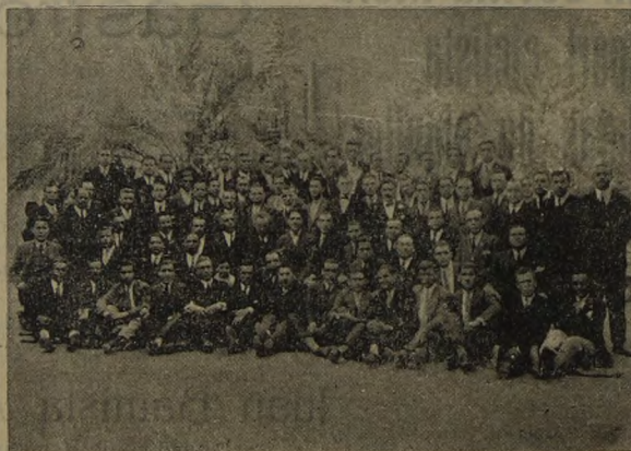
POPULAR CORO CLAVÉ

Que ganó el segundo premio en el Certamen de Orfeones celebrado en Cartagena el pasado domingo