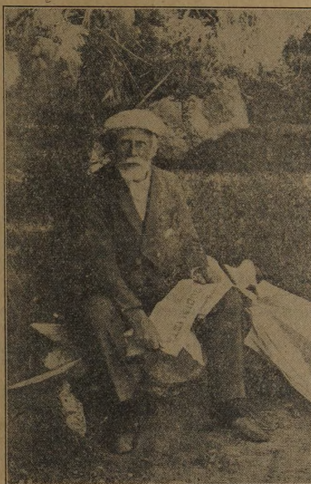
PABLO IGLESIAS Maestro del Socialismo español

zar caminos nuevos, aprovechando lo que creamos conveniente del trazado de los antiguos.