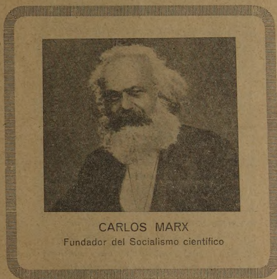
CARLOS MARX Fundador del Socialismo científico

del trabajo, los que en muchos casos podrían evitarse.