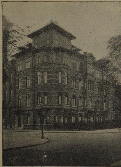
Fachada del hermoso edificio que posee en Amsterdam la Federación Internacional Sindical