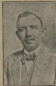
El camarada Henderson, de Inglaterra, Presidente de la Internacional Socialista Obrera, que presidió la sesión inaugural del Congreso de Bruselas, pronunciando un notabilísimo discurso.

—Sí, señor presidente. Sin ofender a nadie, estoy seguro de que no hay en la Sala quien me gane.