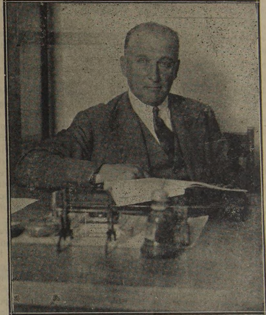
FRANCISCO LARGO CABALLERO Reelegido Secretario de la Unión General de Trabajadores

La Unión General ha salido de este comicio más fuerte y más vigorizada; constituye sin duda alguna una segura esperanza para el país. Y, co-