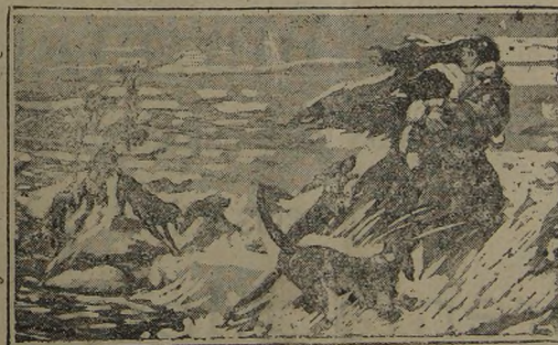
Una escena de la emocionante película «La Cabaña del tío Tom» que se proyectará mañana lunes en el TEATRO LLORENTE.