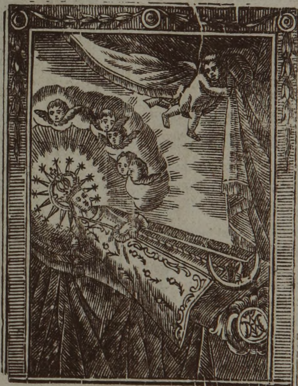
LA VIRGEN DE LA ASUNCIÓN PATRONA DE ELCHE