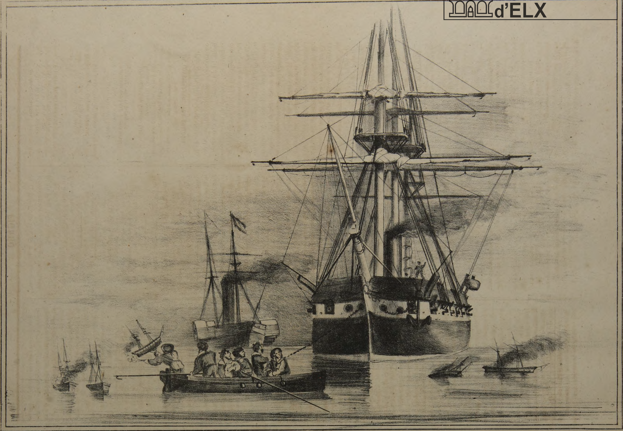
( GUERRA DE CHILE ) REPRESALIAS.