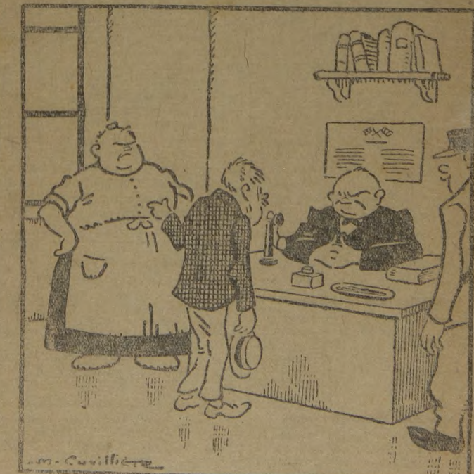
—Le acusan de que ha pagado usted a su mujer. Esto es una cobardía. —Señor comisario, fíjase bien y reconozca que el pegar a una mujer es más bien un acto de verdadero valor.