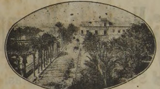
ALICANTE.—Paseo de Ramiro

Alicante y Alcoy deben aproximarse más; sus intereses lo exigen. La industria alicantina, tendría un puerto a tres horas de tren y las operaciones se verificarían con mayor rapidez contribuyendo a que nuestra riqueza aumentara. Los carbones del puerto de Alicante, también llegarían con gran ahorro de tiempo y costos los pueblos levantinos.