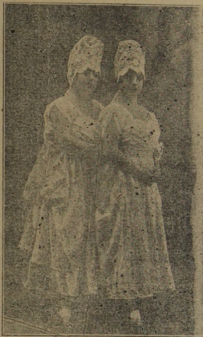
Las aplaudidas bailarinas hermanas Corales