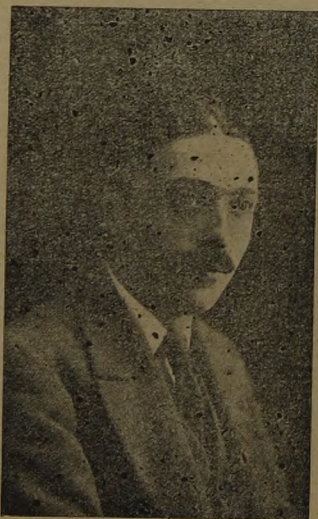
El maestro compositor Modesto Pérez