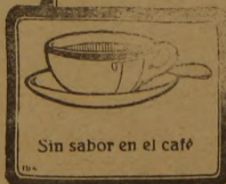
Sin sabor en el caf é

En cualquier farmacia o droguer í a. Frasco para cuatro meses de uso, 4 pesetas.