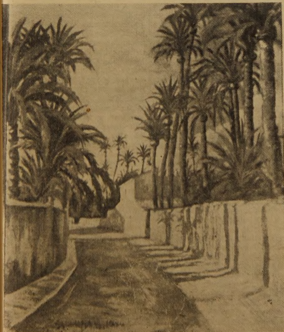
PAISAJE DE ELCHE - OLEO GALIANA MACIÁ

que apuntaba el alcalde de Benidorm en la reciente Asamblea de los Centros de Iniciativa y Turismo y que anotábamos al principio, no es para desechar- la, sino más bien para tener en cuenta y municipio, provincia y Estado, ordenarlo en la fuerza que le da su poder ejecutivo.