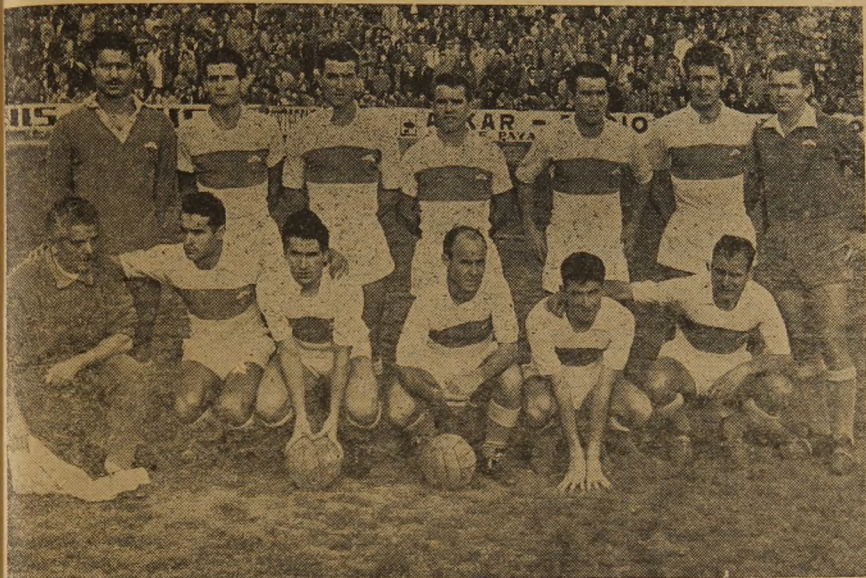
Equipo del Elche que, con alguna modificación en sus líneas, será el que esta tarde frente al Levante, sabrá conseguir los dos puntos tan necesarios para el ascenso a la División de Honor.