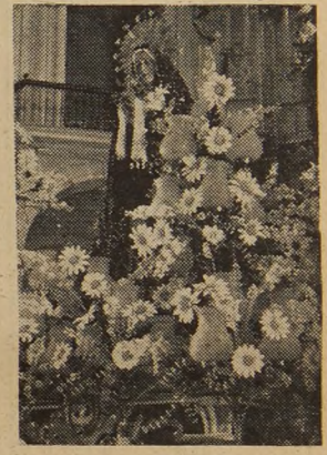
SANTISIMA VIRGEN DE LOS DOLORES