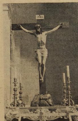
Cristo de la Misericordia