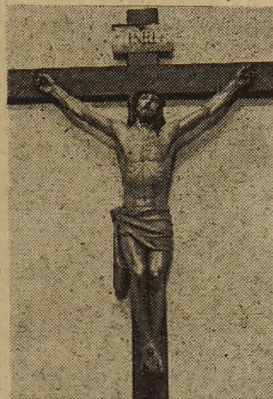
CRISTO DE LA PENITENCIA

Pero antes quisiéramos que fuese su objetivo purificarla de las adherencias nocivas que la afean, que la oscurecen y que a los demás desedifican. Ciertamente en ellas participan muchos que en ninguna otra ocasión asistirán a otros actos religiosos, pero no han pensado que también allí en Jerusalén fueron muchos los que participaron y fueron espectadores de la pasión de Cristo y, sin embargo, no