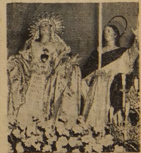
SAN JUAN Y LA VIRGEN