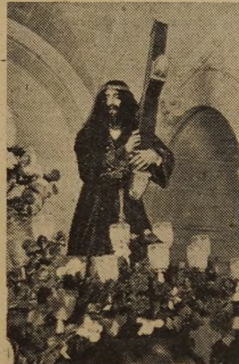
NUESTRO PADRE JESUS NAZARENO