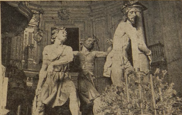
LA FLAGELACION DE JESUS

atinaron a ver a Dios a través de la sangre, salivazos y polvo del rostro de Jesús.