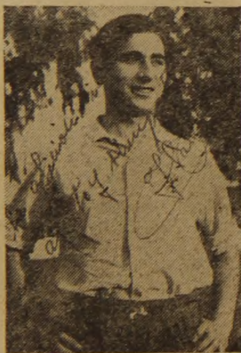
SANCHEZ, la última adquisición de Altabix, que se espera debute hoy en Granada