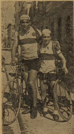
1945. García espera la salida en Alicante

muchísimas el segundo y tercer lugar de las clasificacio-