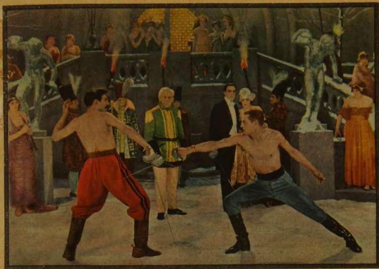
SELECCIÓN ÓPTIMA - PROGRAMA VILASECA Y LEDESMA, S. A.

"LOS ENEMIGOS DE LA MUJER" de V. Blasco Ibáñez