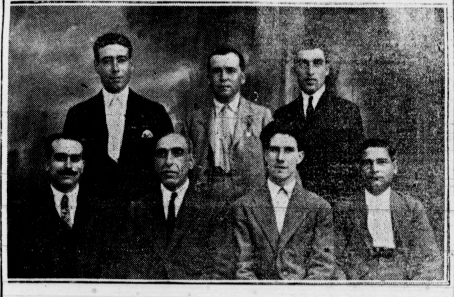
Junta Directiva del «Popular Coro Clavé»

Cuenta la agrupación con ochocientos socios, y dentro de la misma funciona un Orfeón que ha obtenido en diferentes actuaciones muy ruidosos triunfos, poniendo muy alto el nombre esclarecido de Elche. ¡Lástima grande que la falta de apoyo moral le im-