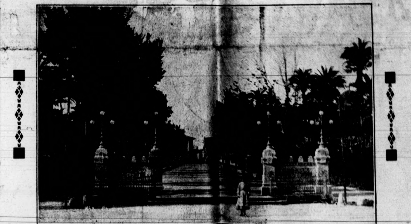
PASEO DE ENTRADA A LA CIUDAD

D. EMIGDIO SANTAMARIA.—Nació el 3 de Agosto de 1880. Murió en Madrid el día 27 de Julio de 1882, violentamente asesinado por unos ladrones. Fué el último ilicitano que perteneció a las Cortes. En Alicante publicó el periódico «El Duende». Fué alcalde de Elche. Por cuestiones políticas estuvo preso en el castillo de Alicante y luego en el presidio de Cartagena, sin que le juzgara ningún tribunal. De Cartagena lo llevaron al penal de Ceuta, y de allí fué desterrado a Canarias, de donde regresó en 1887. Fué disputado por Alicante