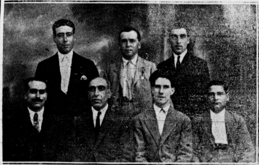
Junta Directiva del «Popular Coro Clavé»

Cuenta la agrupación con ochocientos socios, y dentro de la misma funciona un Orfeón que ha obtenido en diferentes actuaciones muy ruidosos triunfos, poniendo muy alto el nombre esclarecido de Elche. ¡Lástima grande que la falta de apoyo moral le im-