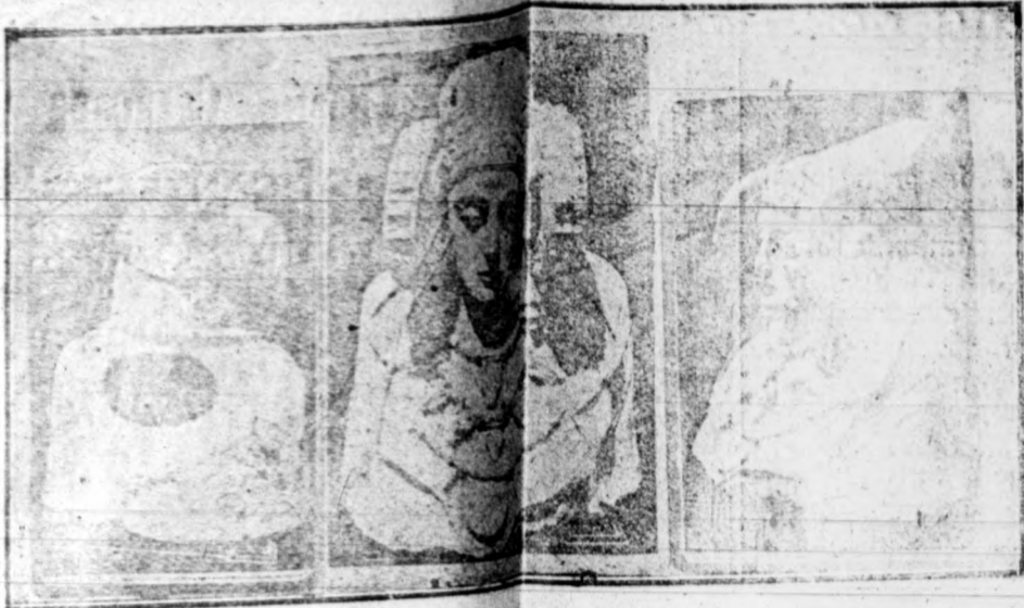
LA DAMA DE ELCHE